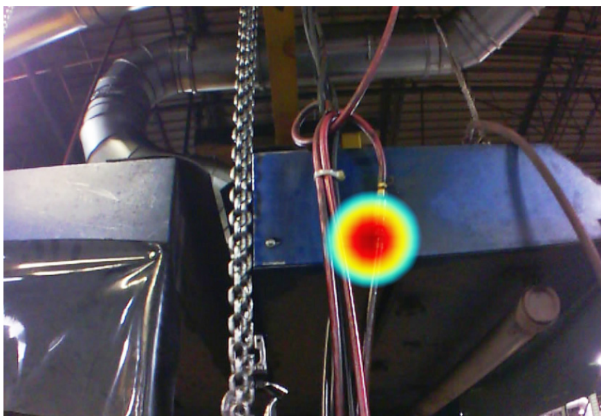
Imágenes tomadas con la cámara acústica industrial ii900 en un entorno industrial.

Fluke. Keeping your world up and running.®